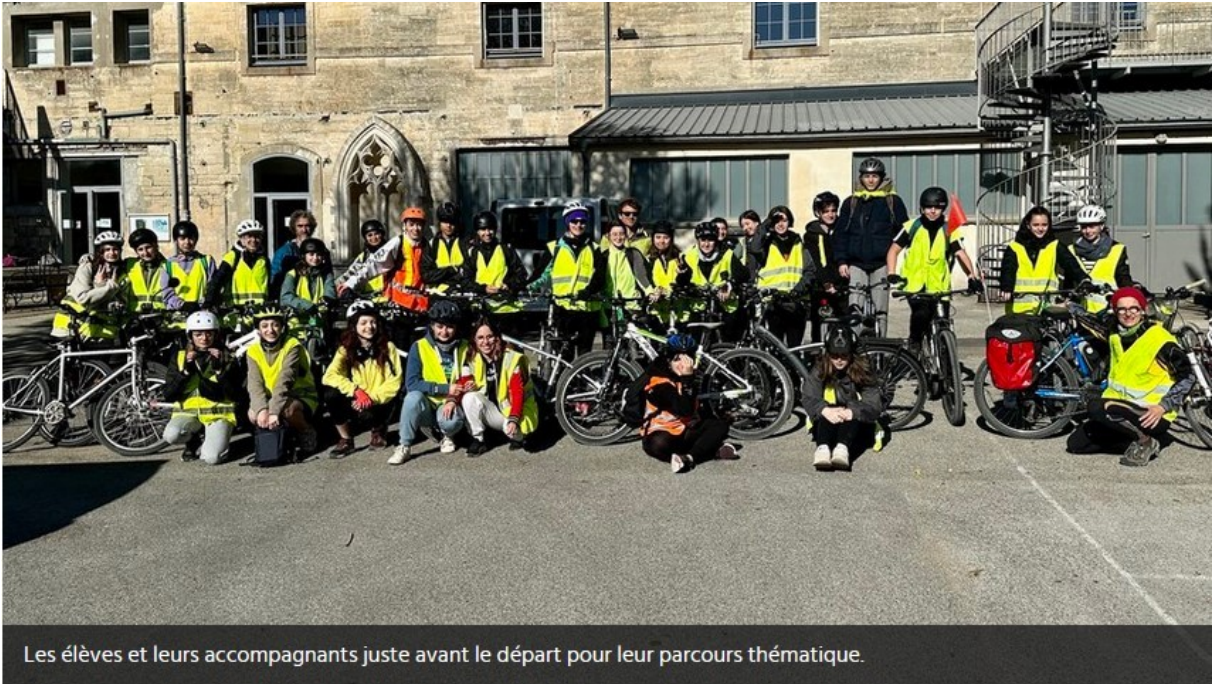
Les élèves et leurs accompagnants juste avant le départ pour leur parcours thématique.