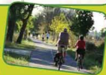
The route goes through a farming landscape typical of the Sommières area. Grapes and olives are crops that date back to ancient times. They are very well suited to the Mediterranean climate and the landscape has been modelled for them to give the best.