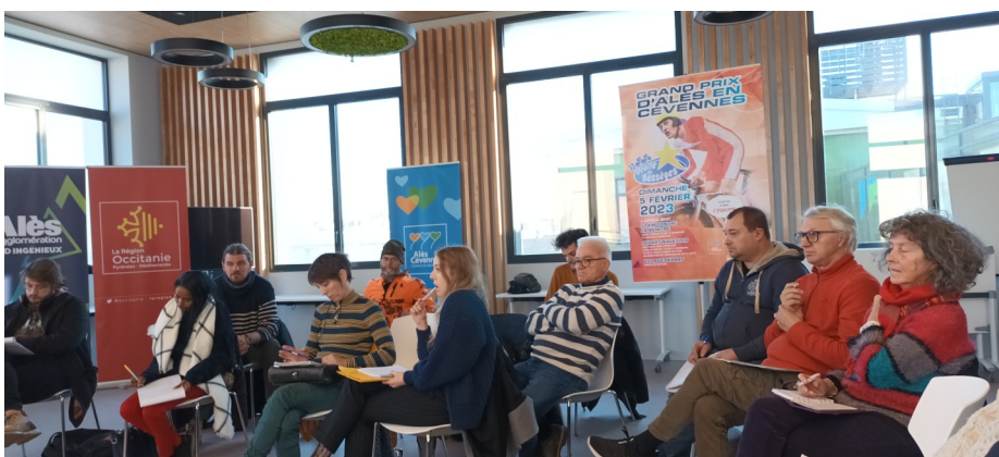
Partageons la route en Cévennes / Cyclo Rando Ales en Cévennes Région Occitanie, préparation de la journée citoyenne du mercredi 10 mai 2023