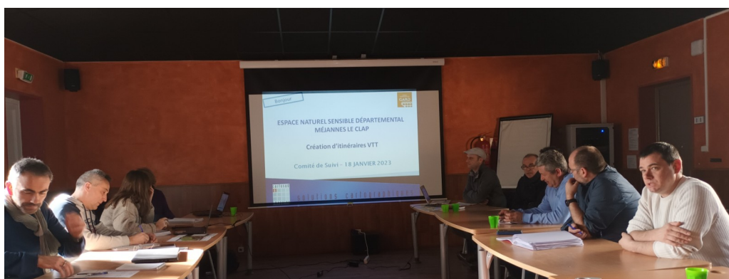
Cyclo Rando Ales en Cévennes Réunion du comité de pilotage de la rénovation du centre sportif de Méjannes-le Clap, et la création du pole vélo dans le cadre des jeux Paris 2024