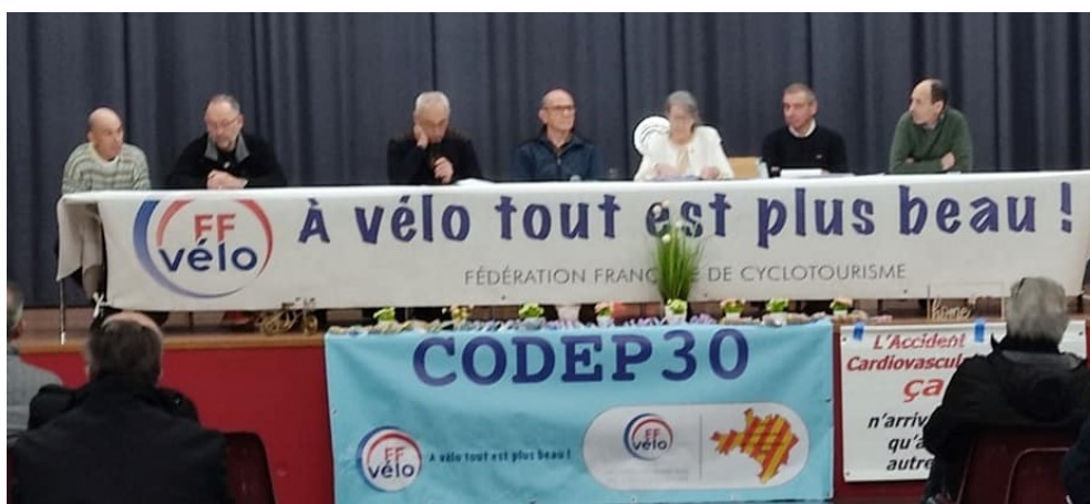
Partageons la route en Cévennes Invitation à l'Assemblée Générale du Comité Départemental de Cyclotourisme du Gard