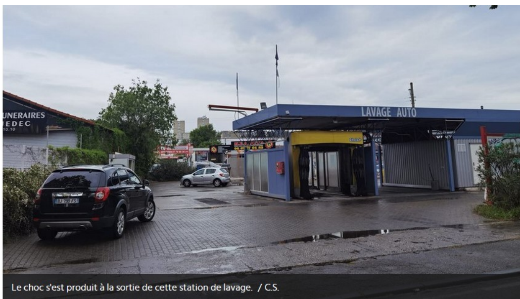
Le choc s'est produit à la sortie de cette station de lavage.

Les faits se sont déroulés au nord d'Alès , sur la route des Fumades, peu après 16h30, le mardi 19 avril. 2022 Un dramatique accident de la circulation s'est produit ce mardi 19 avril, au nord d'Alès, dans le Gard. Sur la route des Fumades, sur le territoire de la commune de Salindres, une collision s'est produite, peu après 16h30, entre un motard et deux cyclistes. Quatorze sapeurs-pompiers et six véhicules ont rapidement été mobilisés pour porter secours aux victimes. Malheureusement, une personne décédée est à déplorer. Le chauffeur de la moto, grièvement blessé, a été évacué, en hélicoptère, vers le centre hospitalier Carémeau de Nîmes. Le troisième individu concerné par cet accident a également été blessé