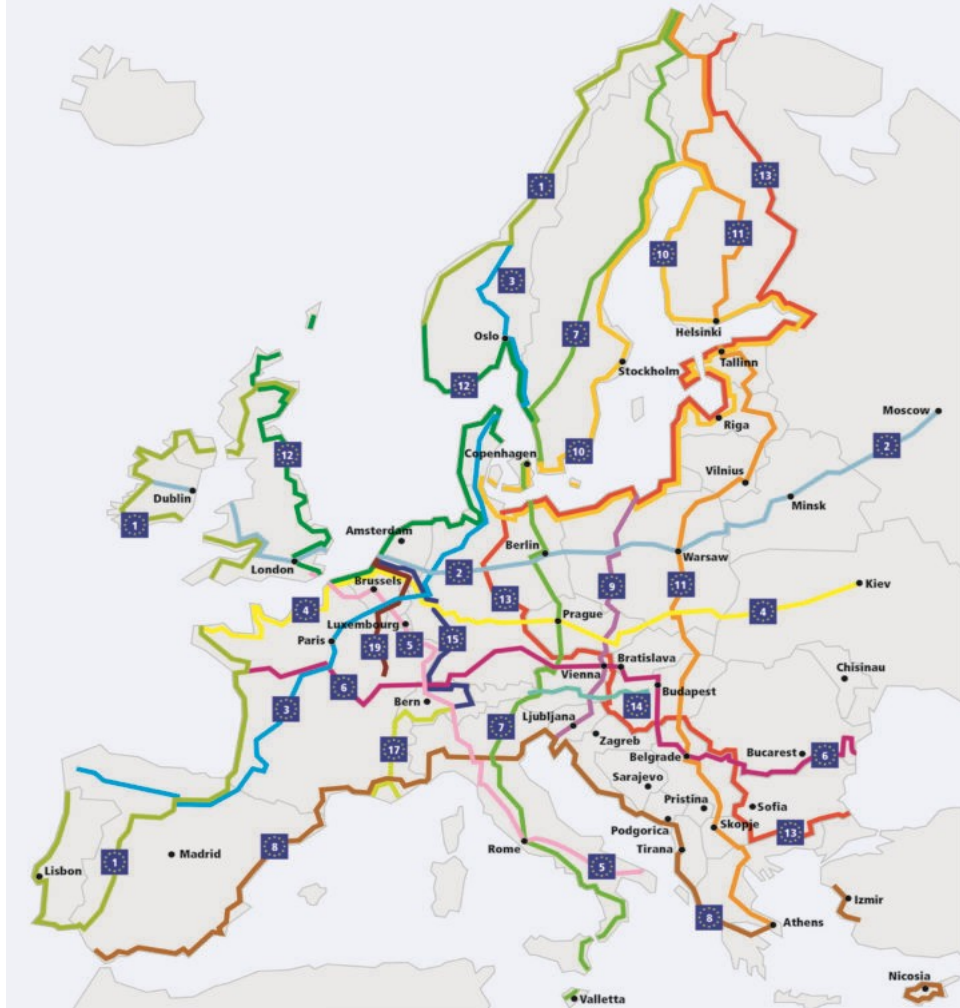
Schéma des véloroutes européennes - EuroVelo

Comment le vélo peut-il réenchanter notre territoire ?