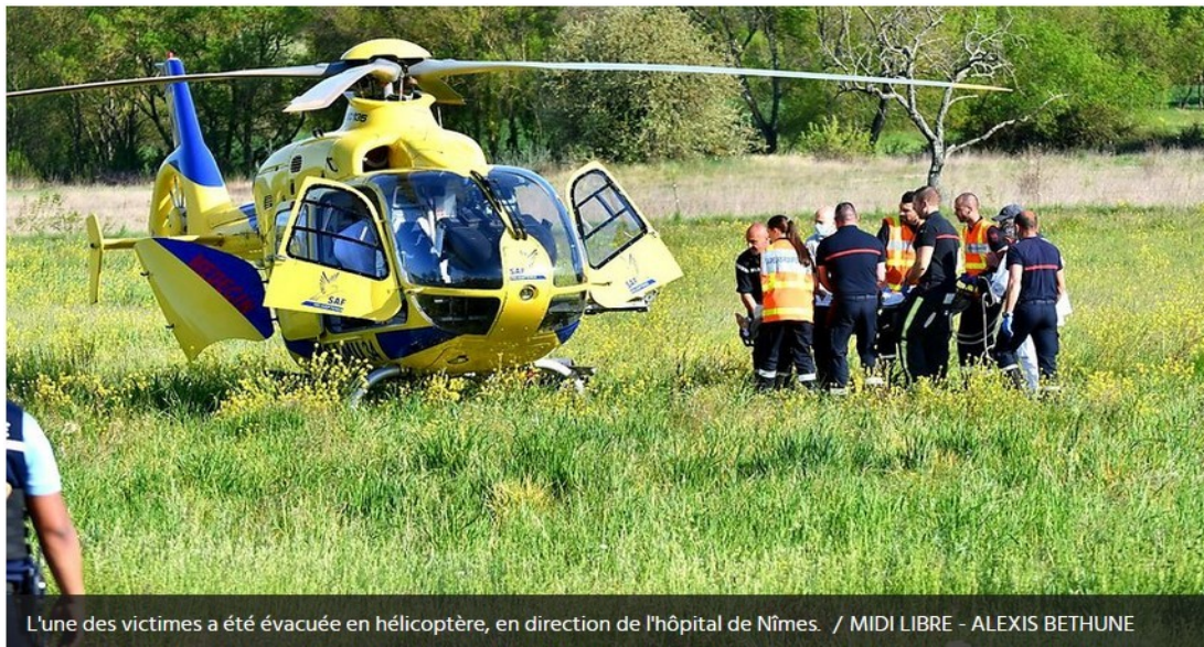
L'une des victimes a été évacuée en hélicoptère, en direction de l'hôpital de Nîmes.

Les faits se sont déroulés au nord d'Alès , sur la route des Fumades, peu après 16h30, le mardi 19 avril. 2022 Un dramatique accident de la circulation s'est produit ce mardi 19 avril, au nord d'Alès, dans le Gard. Sur la route des Fumades, sur le territoire de la commune de Salindres, une collision s'est produite, peu après 16h30, entre un motard et deux cyclistes. Quatorze sapeurs-pompiers et six véhicules ont rapidement été mobilisés pour porter secours aux victimes. Malheureusement, une personne décédée est à déplorer. Le chauffeur de la moto, grièvement blessé, a été évacué, en hélicoptère, vers le centre hospitalier Carémeau de Nîmes. Le troisième individu concerné par cet accident a également été blessé